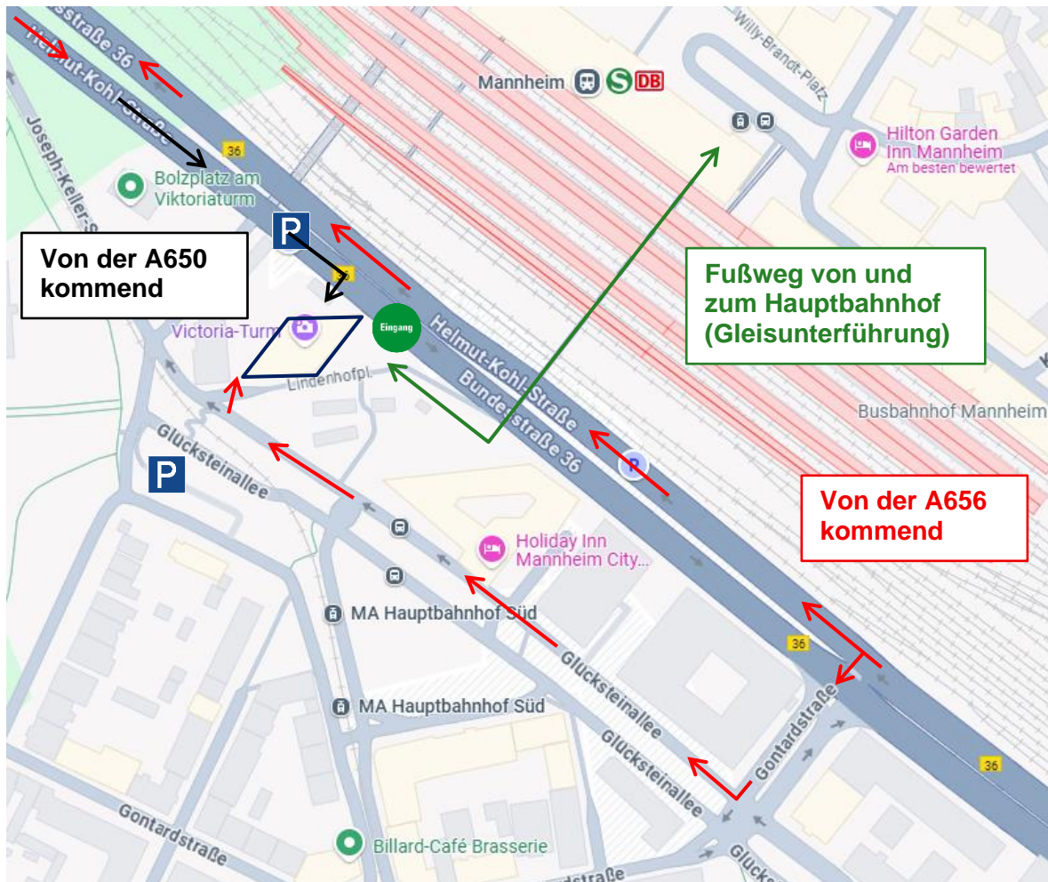
Abb. 1: Am Victoria-Turm, Quelle: Google Maps, weitere Beschriftungen angefügt