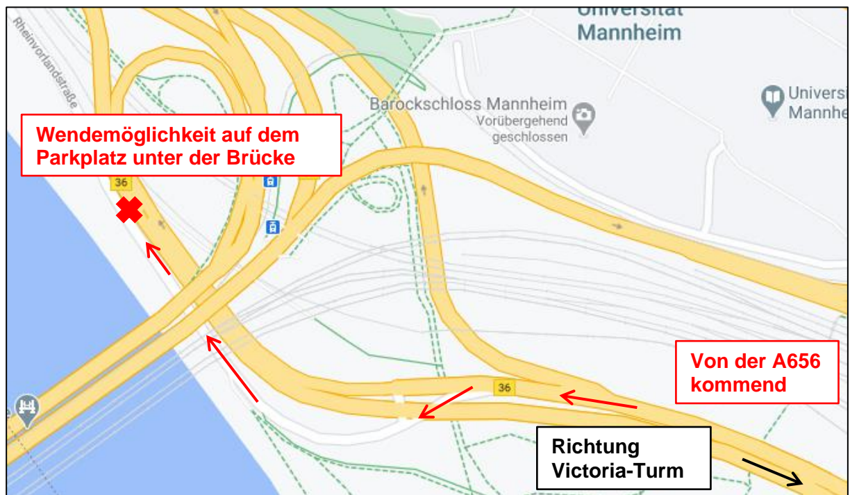
Abb. 2: Wendemöglichkeit, Quelle: Google Maps, weitere Beschriftungen angefügt