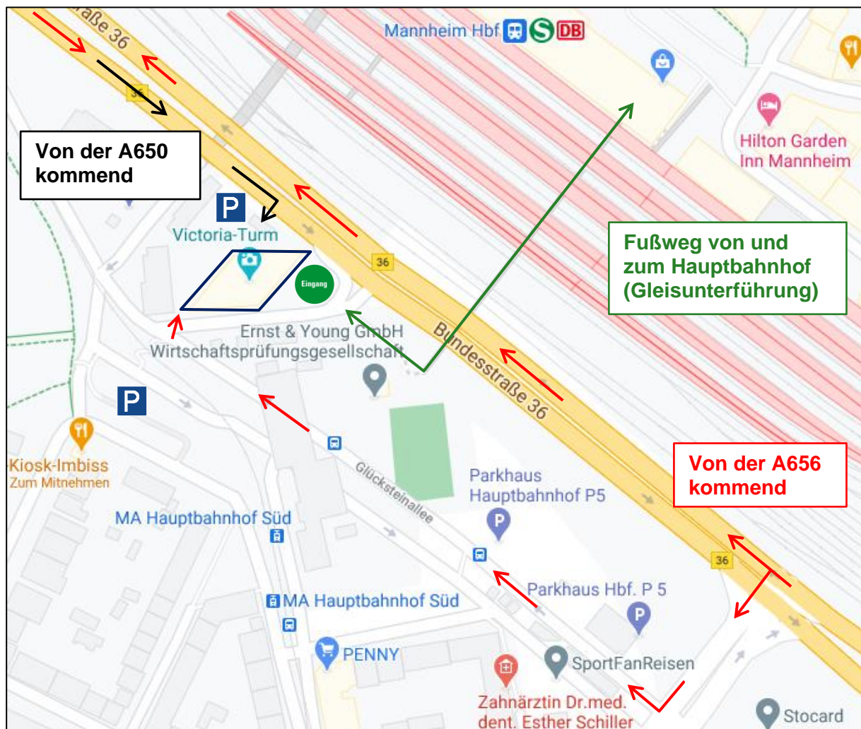
Abb. 1: Am Victoria-Turm, Quelle: Google Maps, weitere Beschriftungen angefügt